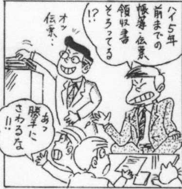
税務調査期間を5年に延長