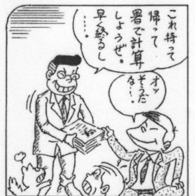
資料、伝票等の領置権の拡大