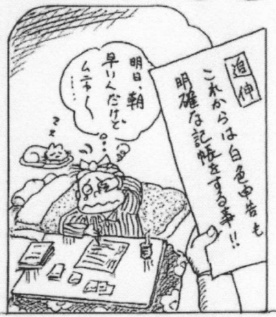
全業者に記帳義務をおしつける