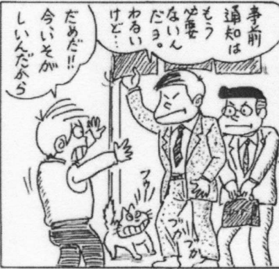
事前通知しないことを合法化