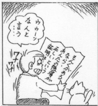
更正の請求は納税者に 拳証責任を押し付け