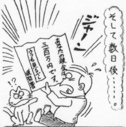
一方的に税金を決められる事に