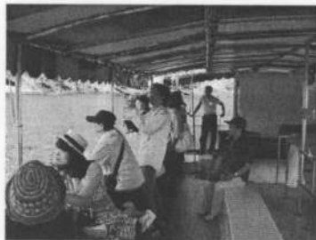
▲水中展望船を楽しむ皆さん