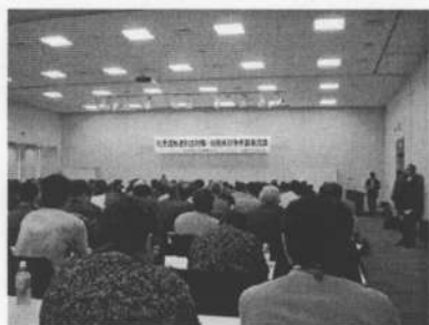
▲多くの参加で通則法改悪について 学びあった全国交流会